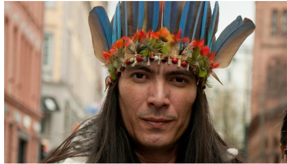
Help Ecuador Action - vide oentrevista y campaña de apoyo para las víctimas del Terremoto, Oslo, Noruega 2016