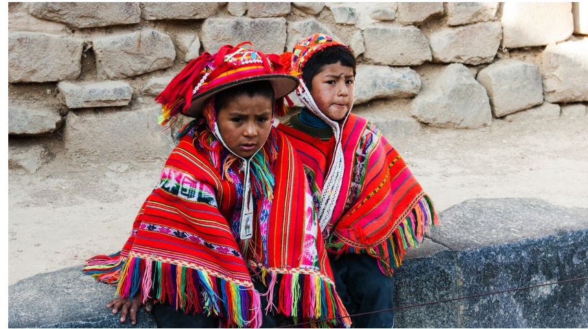
4. Hojas de Coca - 5. Niños con traje regional en Ollantaytambo