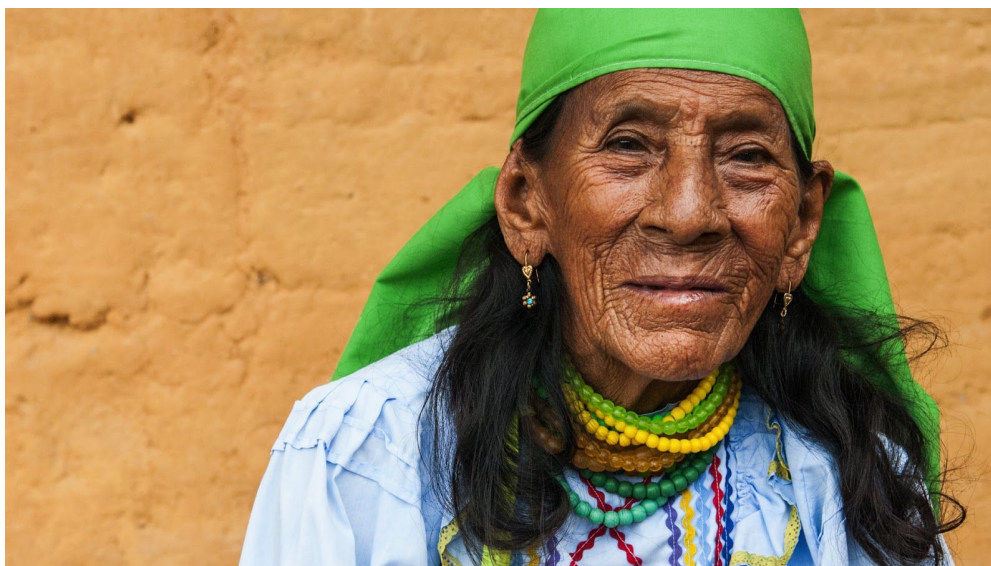
10. Abuela de la municipalidad de Kwechua-Wayku en Lamas, Tarapoto Todas las fotos tomadas en 2015