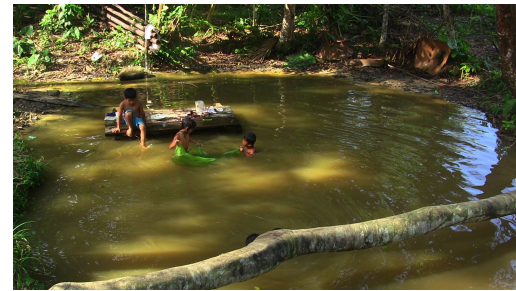
1. Templo de la Luna en Cusco - 2. Urubamba Valle Sagrado - 3. Tribu Huitoto-Muroy en Amazonas