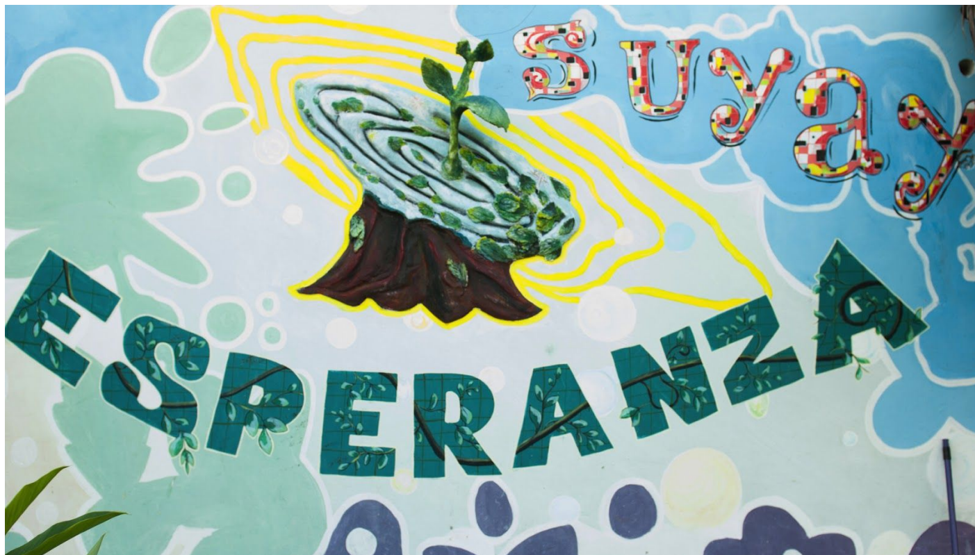
4. y 5. Suyay ONG en Iquitos