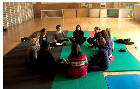
Fotos de talleres de QiYo Yoga, Yoga y movimiento en diferentes ciudades de España y Noruega 2016