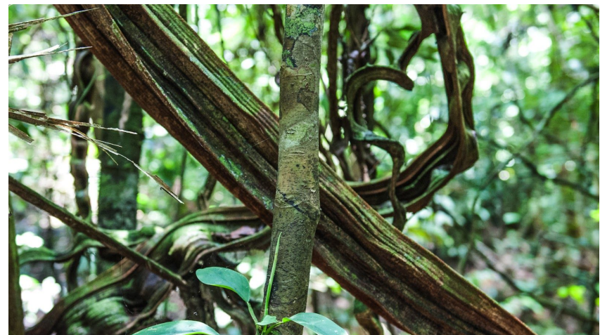
6. Mercado en Iquitos - 7. Selva Amazónica