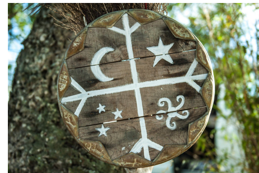
Ceremonia de Temazcal con Flavia de Chile en Cádiz, España 2016